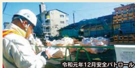
令和元年12月安全パトロール