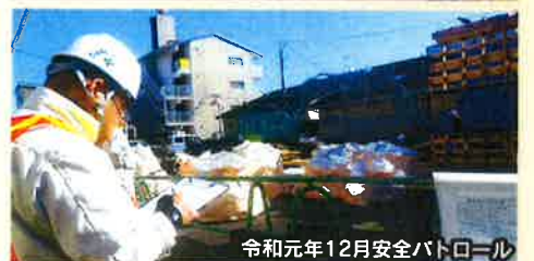
令和元年12月安全パトロール