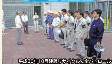
平成30年10月建設リサイクル安全パトロール