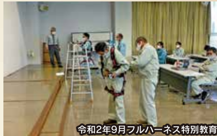
令和2年9月フルハーネス特別教育