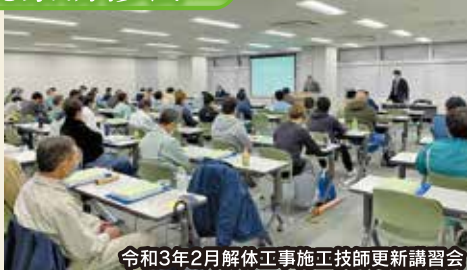
令和3年2月解体工事施工技師更新講習会