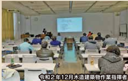
令和2年12月木造建築物作業指揮者