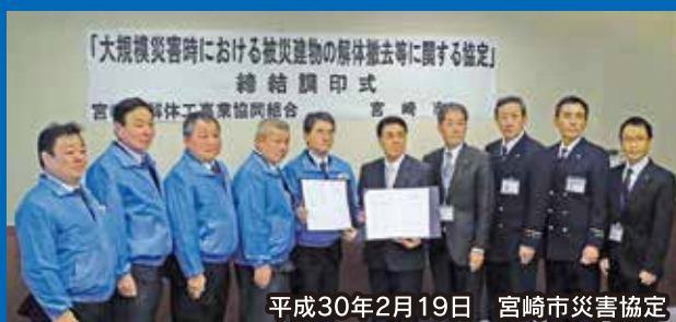
平成30年2月19日 宮崎市災害協定