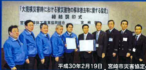
平成30年2月19日 宮崎市災害協定