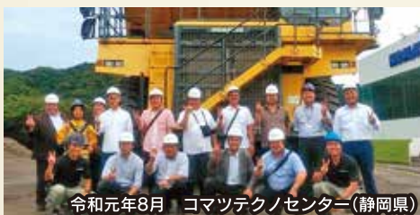
令和元年8月 コマツテクノセンター(静岡県)