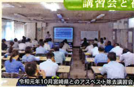
令和元年10月宮崎県とのアスベスト除去講習会