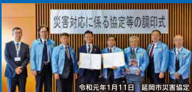
令和元年1月11日 延岡市災害協定