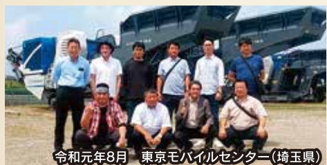
令和元年8月 東京モビルセンター(埼玉県)