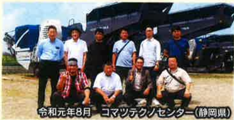
令和元年8月 コマツテクノセンター(静岡県)