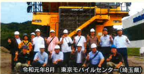
令和元年8月 東京モバイルセンター(埼玉県)