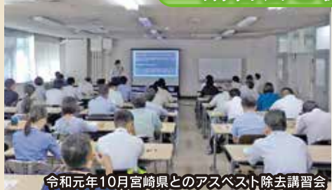
令和元年10月宮崎県とのアスベスト除去講習会