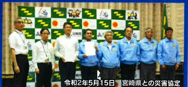
令和2年5月15日 宮崎県との災害協定