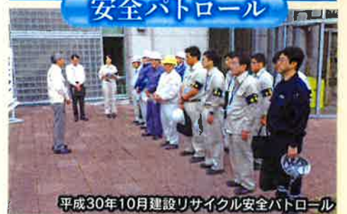
平成30年10月建設リサイクル安全パトロール