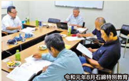
令和元年8月石綿特別教育