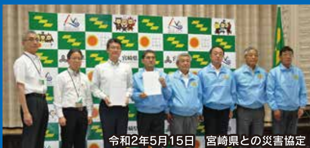
令和2年5月15日 宮崎県との災害協定