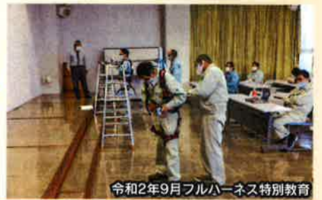
令和2年9月フルハーネス特別教育