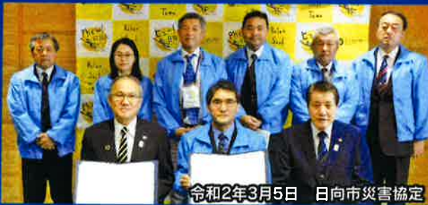
令和2年3月5日 日向市災害協定