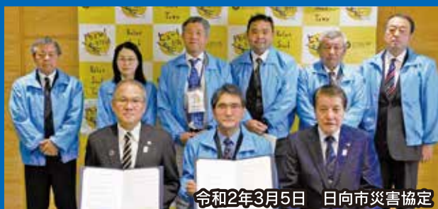
令和2年3月5日 日向市災害協定