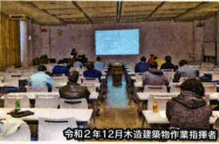
令和2年12月木造建築物作業指揮者