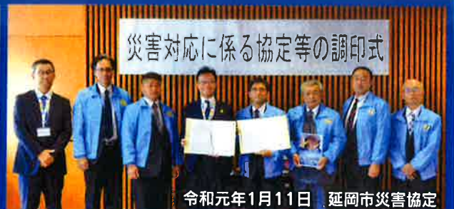
令和元年1月11日 延岡市災害協定