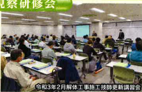
令和3年2月解体工事施工技師更新講習会