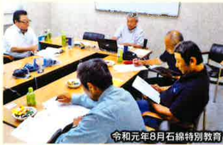
令和元年8月石綿特別教育